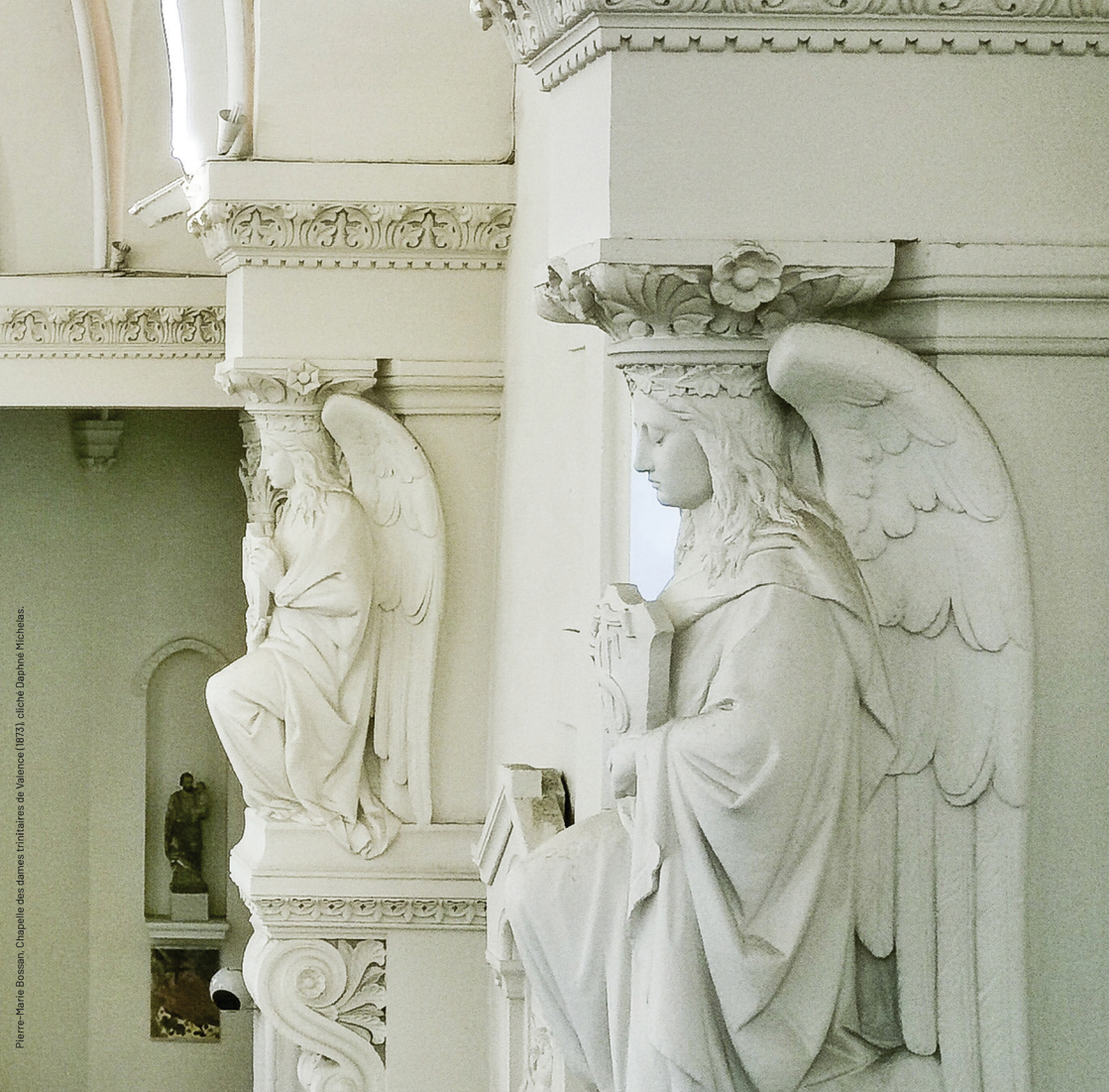
Pierre-Marie Bossan, Chapelle des dames trinitaires de Valence (1873), cliché Daphné Michélas.

10 & 11 OCTOBRE 2024 - JOURNÉES D'ÉTUDES